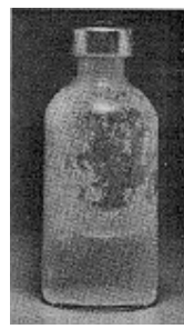
Fig. 3 - Não use este medicamento se partículas no fundo ou na parede derem ao frasco um aspecto fosco (embaçado).

Uso de seringa adequada: as doses de insulina são medidas em unidades . O número de unidades em cada mililitro (mL) está claramente impresso na embalagem. Cada tipo de insulina está disponível na concentração de 100 unidades/mL. É importante entender as graduações na seringa porque o volume a ser injetado depende da concentração, que é o número de unidades por mL. Por esta razão, deve-se utilizar sempre uma seringa graduada para a concentração de insulina. Erro no uso da seringa pode levar a um erro na dose, causando sérios problemas, como variação na glicemia (taxa de glicose no sangue) que pode ser muito baixa ou muito alta.