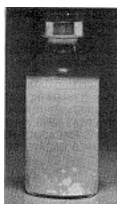
Fig. 2 - Não use este medicamento se houver grumos em suspensão (soltos) no líquido após a agitação.