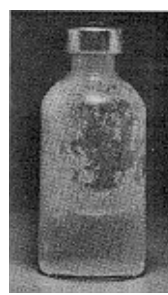
Fig. 3 - Não use este medicamento se partículas no fundo ou na parede derem ao frasco um aspecto fosco (embaçado).

Uso de seringa adequada: as doses de insulina são medidas em unidades . O número de unidades em cada mililitro (mL) está claramente impresso na embalagem. Cada tipo de insulina está disponível na concentração de 100 unidades/mL. É importante entender as graduações na seringa porque o volume a ser injetado depende da concentração, que é o número de unidades por mL. Por esta razão, deve-se utilizar sempre uma seringa graduada para a concentração de insulina. Erro no uso da seringa pode levar a um erro na dose, causando sérios problemas, como variação na glicemia (taxa de glicose no sangue) que pode ser muito baixa ou muito alta.