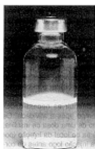
Fig. 1 - Não use este medicamento se o material permanecer no fundo do frasco após a agitação.

Verificar sempre o frasco de insulina antes de usar. Se você notar qualquer diferença na aparência ou alterações marcantes nas características da insulina, consulte o médico.